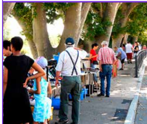
Flâner Découvrir Bavarder Echanger

L'incontournable rendez-vous annuel pour tous les amateurs de revues, livres, timbres, magazines, disques, affiches, journaux, etc.