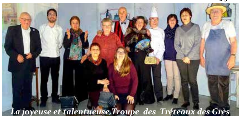
La joyeuse et talentueuse Troupe des Tréteaux des Grès