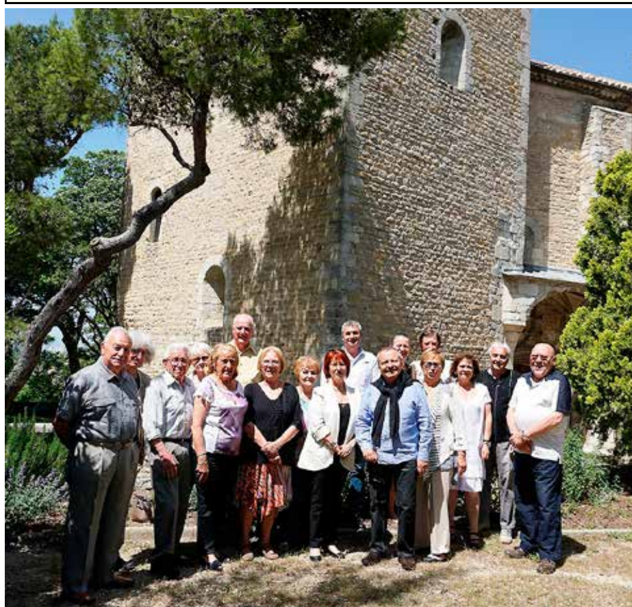
Le TRADITIONNEL APRES - MIDI THEATRAL du 05 février

Juste quelques mots pour vous souhaiter un bel et agréable été. Je donne rendez-vous à tous les bollénois, au bord du Lez le dimanche matin, pour Lez bouquins. Venez rencontrer les bénévoles du syndicat d'initiative, discuter, vendre ou acheter. Un vrai plaisir de partage et d'accueil, dans notre ville.